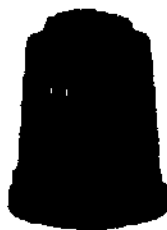
Composter da 300 lt

Di seguito si rappresenta l'immagine relativa al composter chiuso: